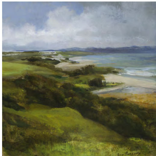
PAISATGE EN VERD Oli s/t. 30 x 30 cm