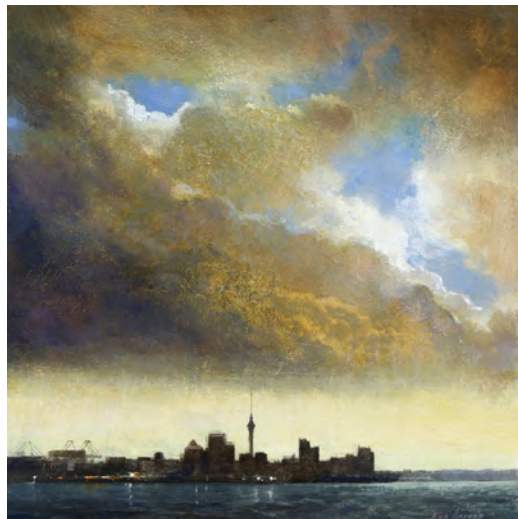
PETITA CIUTAT Oli s/t. 100 x 100 cm