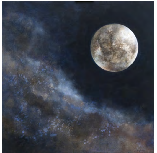
UNIVERS Oli s/t. 100 x 100 cm