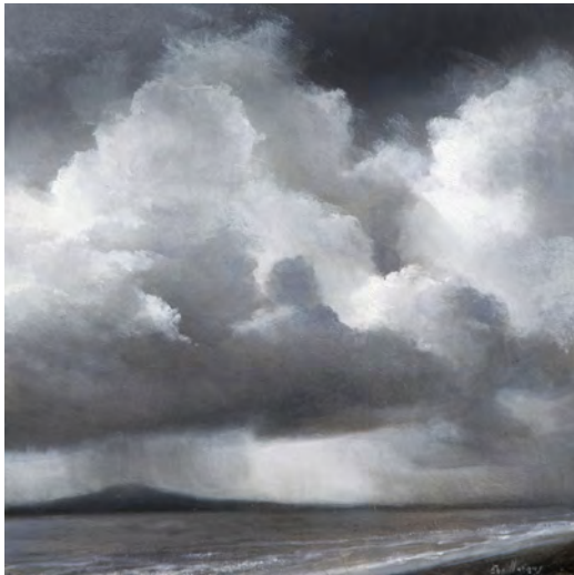
BLANCS Oli s/t. 30 x 30 cm