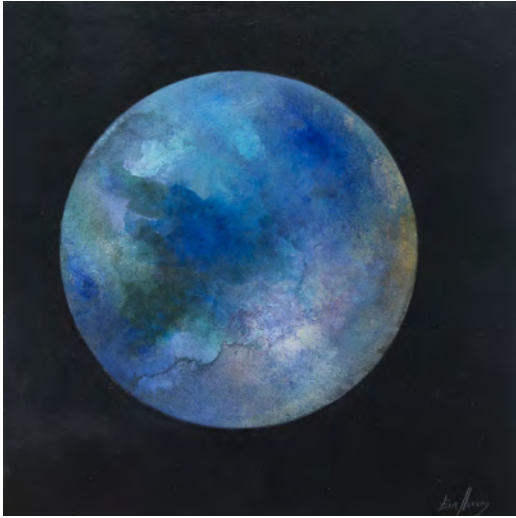
TITAN Oli s/t. 30 x 30 cm