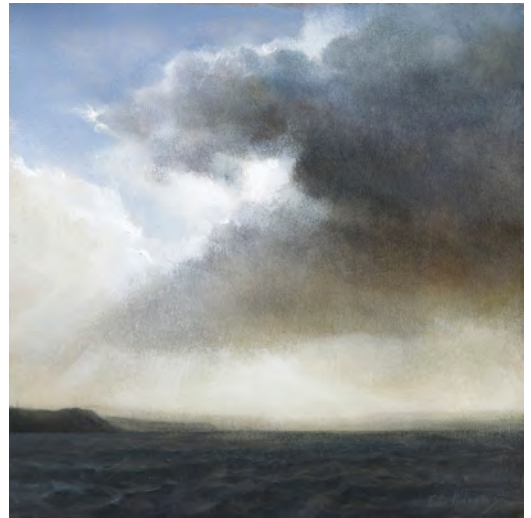
LLUM Oli s/t. 30 x 30 cm