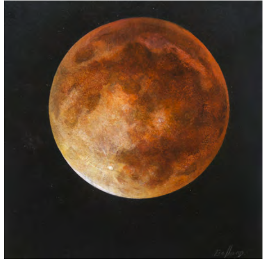
LLUNA VERMELLA Oli s/t. 30 x 30 cm