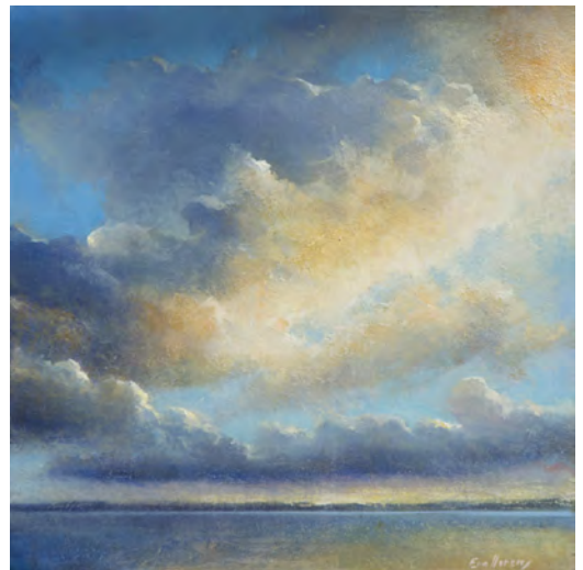
NÚVOLS GROCS Oli s/t. 30 x 30 cm