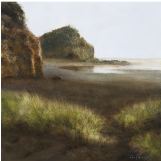
ROQUES Oli s/t. 30 x 30 cm