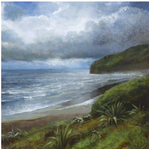
TEMPESTA II Oli s/t. 30 x 30 cm