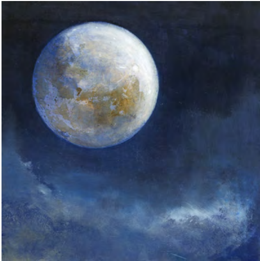
LLUNA BLAVA Oli s/t. 30 x 30 cm