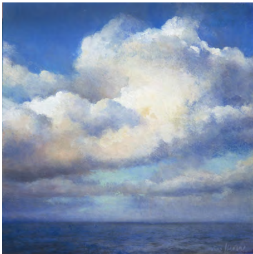
NÚVOLS BLAUS Oli s/t. 30 x 30 cm