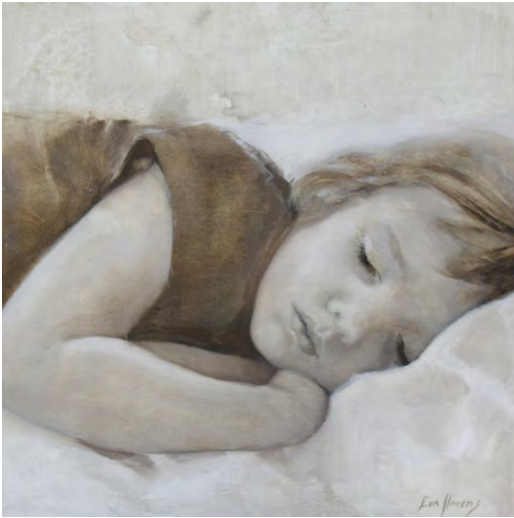
EL SOMNI Oli s/t. 30 x 30 cm