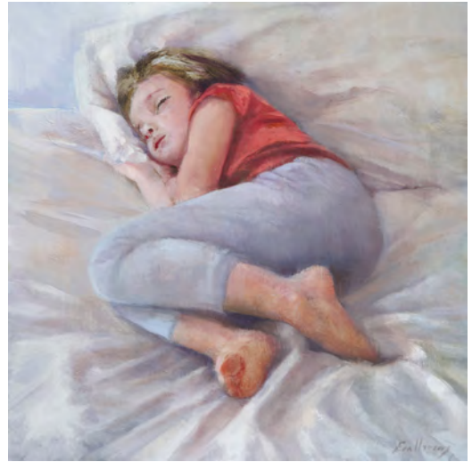
DORMINT Oli s/t. 30 x 30 cm